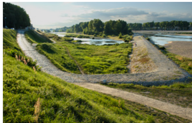
Orléans, extrémité du dail sur la rive gauche, ph. Robert Manoury.