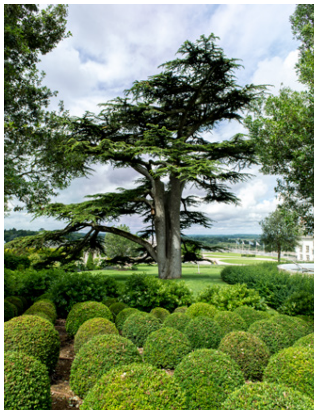
Amboise, jardin d'agrément du château, ph. Vanessa Lamorlette-Pingard.