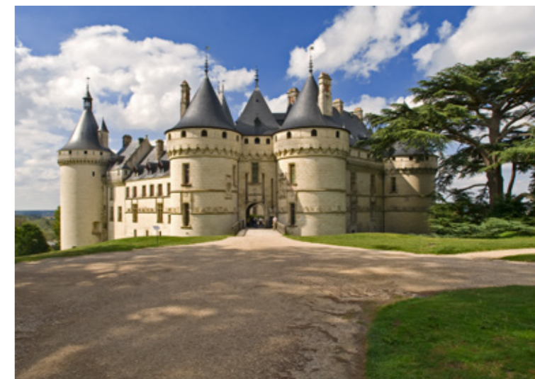
Château de Chaumont-sur-Loire, ph. Hubert Bouvet.

■ La Région Centre-Val de Loire est propriétaire du Domaine de Chaumont-sur-Loire , classé Monument Historique, et en assure la conservation, la restauration et l'entretien selon le code du patrimoine. Au cœur du Val de Loire classé au Patrimoine mondial de l'UNESCO, le domaine accueille également une programmation artistique et le festival international des jardins.