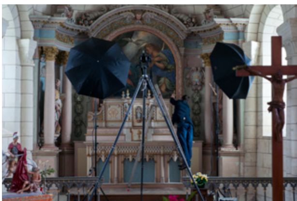
Le Bourday, autel et retable de l'église Saint-Sulpice

Fondé en 1964 par André Malraux, ministre des affaires culturelles, et par André Chastel, historien de l'art, l' Inventaire général du patrimoine culturel a pour but de recenser, d'étudier et de faire connaître le patrimoine architectural et mobilier qui présente un intérêt culturel, historique ou scientifique, en dehors des collections des musées. Cette compétence d'abord mise en œuvre par le ministère de la Culture, a été transférée aux Régions en 2004. Il existe un service chargé de l'inventaire du patrimoine culturel dans chaque région française.