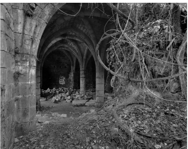
Saint-Paterne-Racan (Indre-et-Loire). Abbaye Notre-Dame de la Clarté-Dieu.