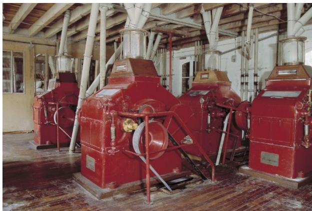
La Guerche-sur-l'Aubois (Cher). Moulin de Faguin.

Pour célébrer cet anniversaire la Région Centre-Val de Loire a mené plusieurs opérations depuis 2022 et a souhaité clôturer l'année du cinquantenaire par une grande exposition photo participative en faisant appel aux habitants de la région mais aussi à tous ceux qui lui sont attachés. Elle voulait montrer toute la diversité de son patrimoine culturel : patrimoine des villes et patrimoine des champs, édifices et objets, églises et cathédrales, maisons de bourg et hôtels particuliers, fermes et châteaux, patrimoine industriel et scientifique, patrimoine des lycées, patrimoine fluvial et des canaux... En votant pour leurs patrimoines préférés, les habitants ont manifesté leur attachement à un lieu, à une œuvre ou au savoir-faire des hommes et des femmes de notre territoire.