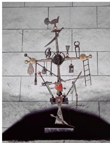
Le Blanc (Indre). Croix de marinier portant les instruments de la Passion.

- sur la Plate-forme Ouverte Patrimoine (POP) du ministère de la Culture : www.pop.culture.gouv.fr