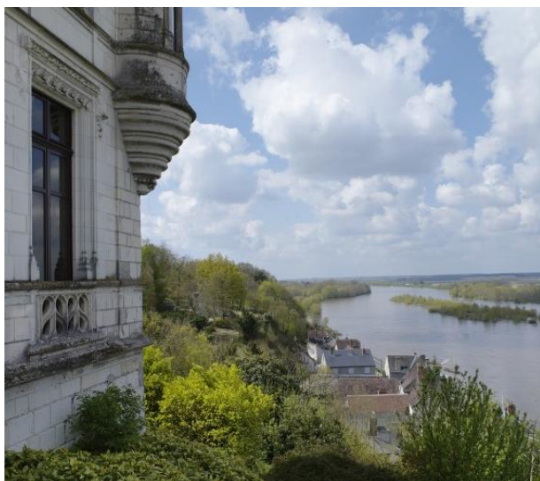
Château de Chaumont-sur-Loire (Loir-et-Cher).

Parc Pasteur (av. Eugène Vignat) - Orléans 19 avril -31 mai 2023