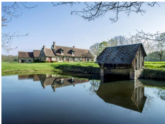
Frazé (Eure-et-Loir). Ferme du Petit Essard.

1972-2022 : depuis 50 ans, « recenser, étudier et faire connaître »