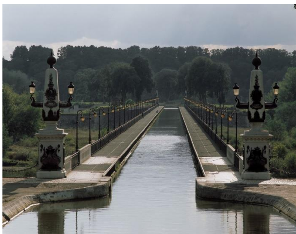
Briare (Loiret). Le Pont-canal.